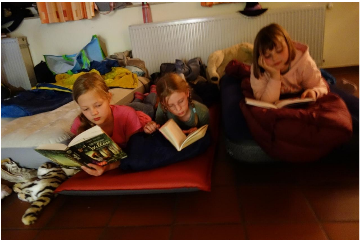
Lesen im Schlafsack bis die Augen zufallen