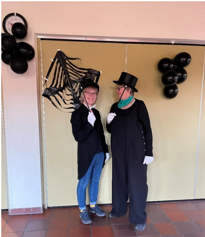
Begrüßung durch die großen Zaubermeister