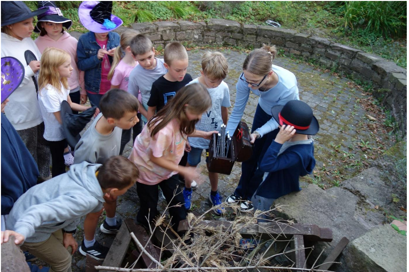
Eine Schatztruhe voller Zauberstäbe