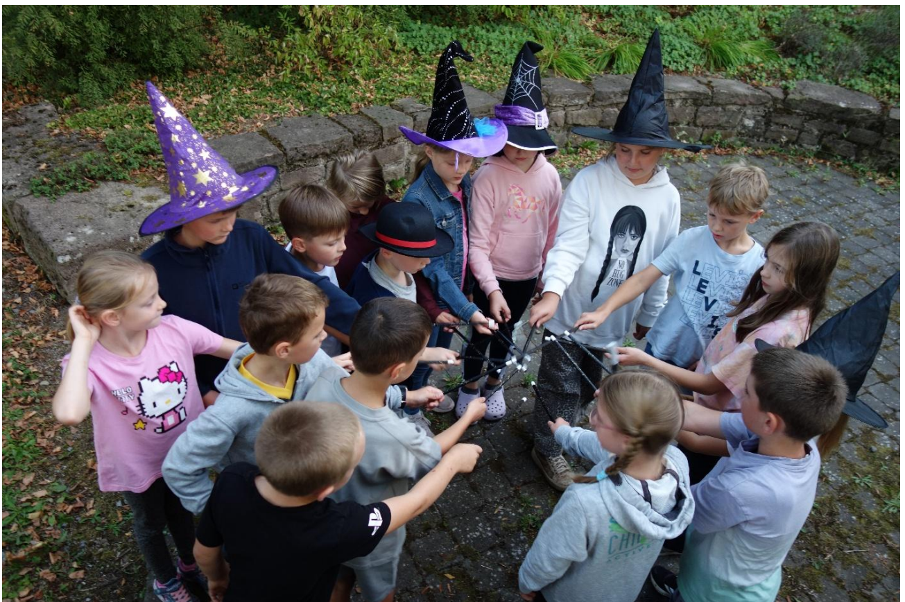
Jetzt wird das Zaubern geübt