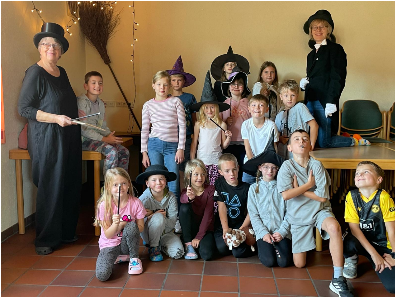
Eine kurze Nacht aber strahlende Augen?