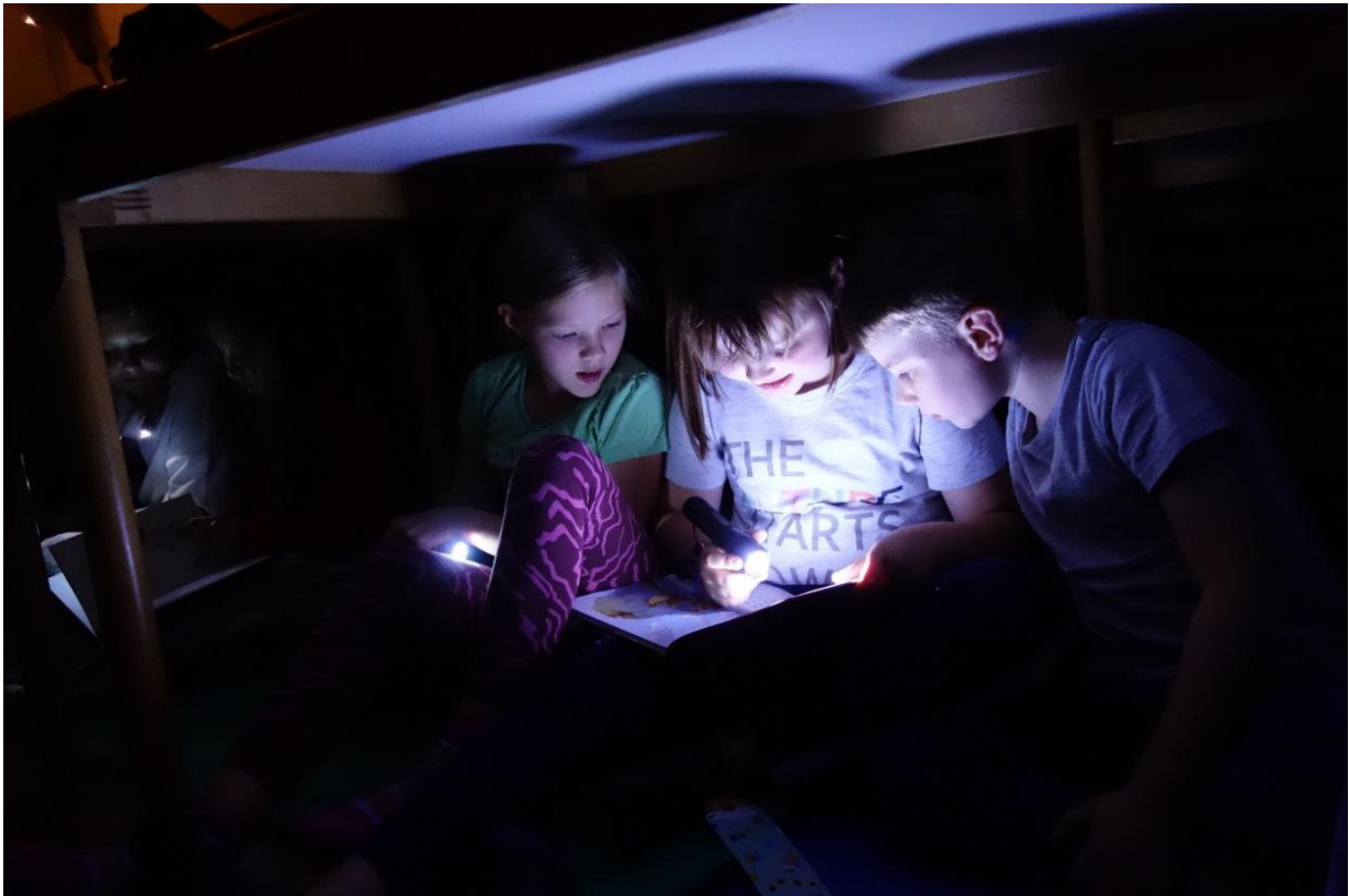
Budenzauber mit Taschenlampe